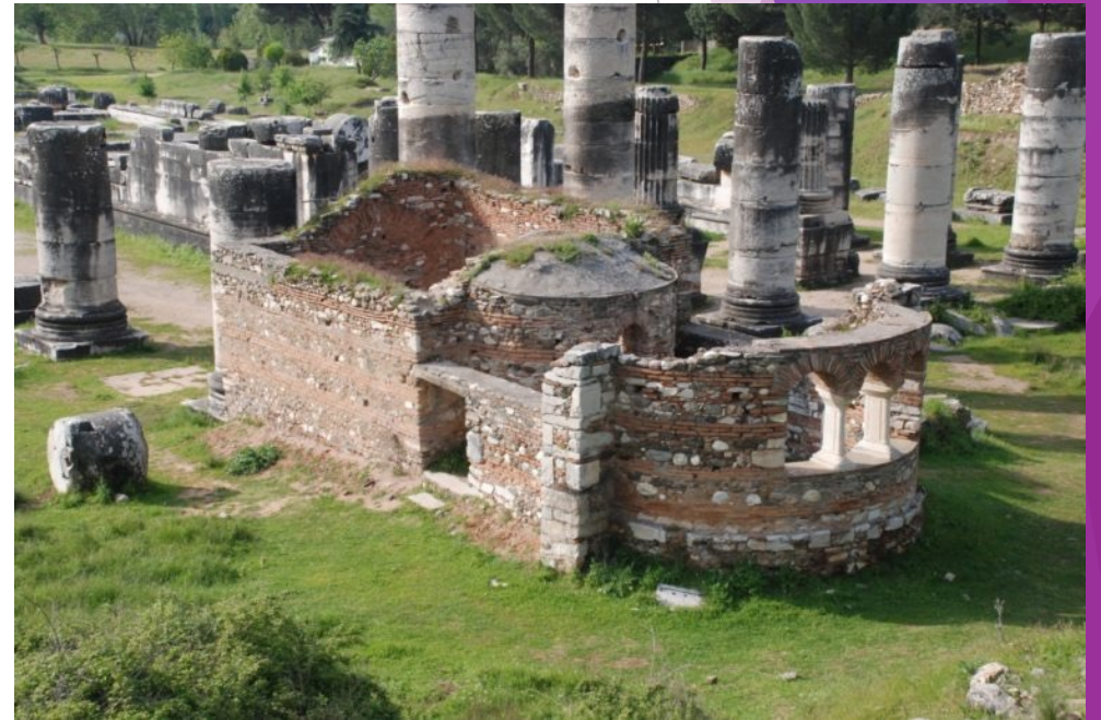
亞底米神廟旁的小教會