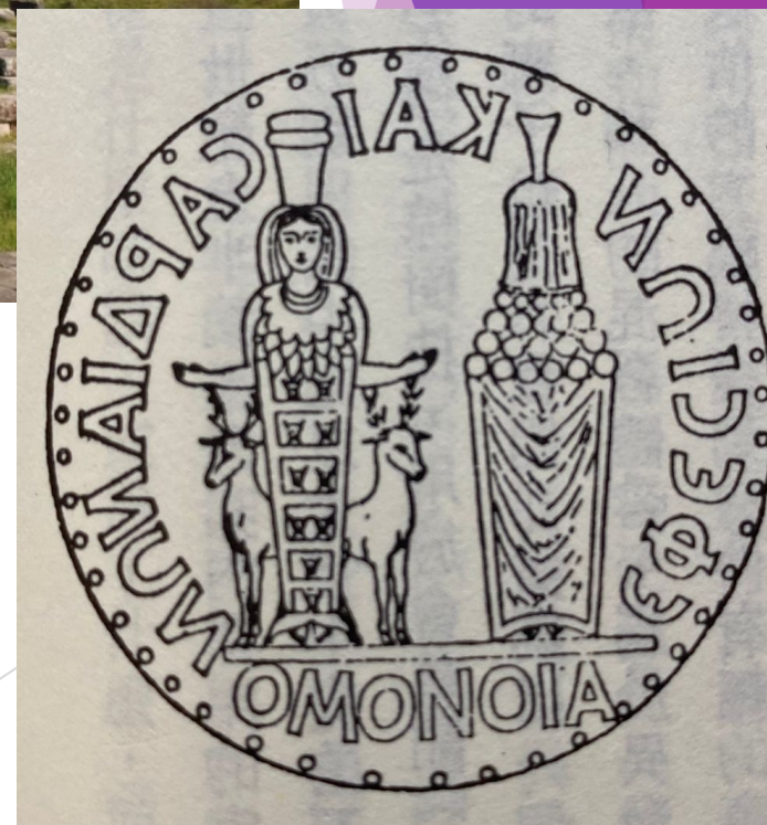
錢幣:亞底米斯女神與西庇利女神