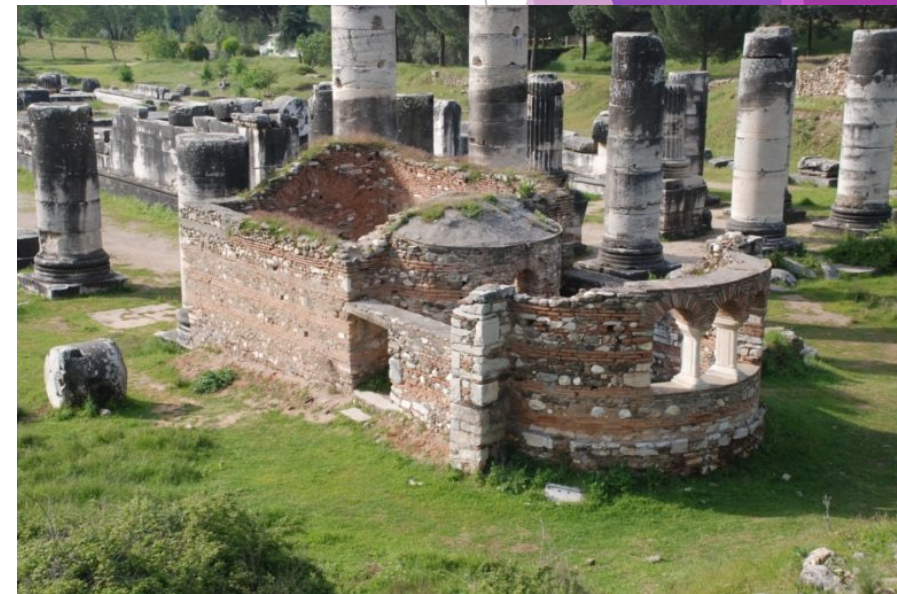
亞底米神廟旁的小教會