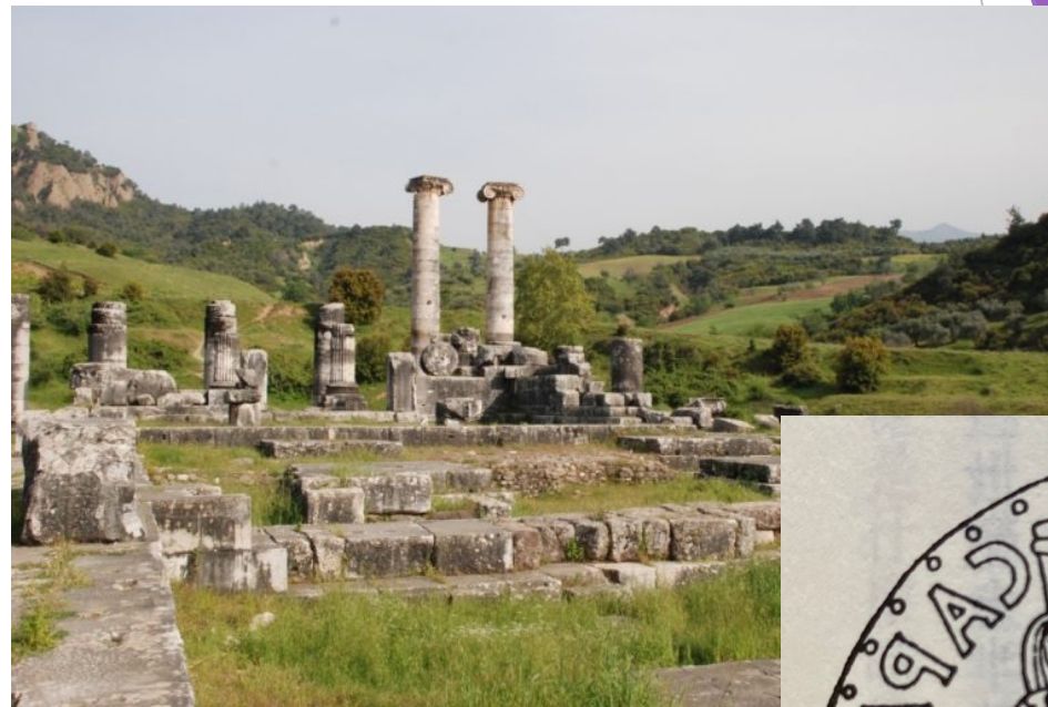
撒狄遺址中的亞底米神廟