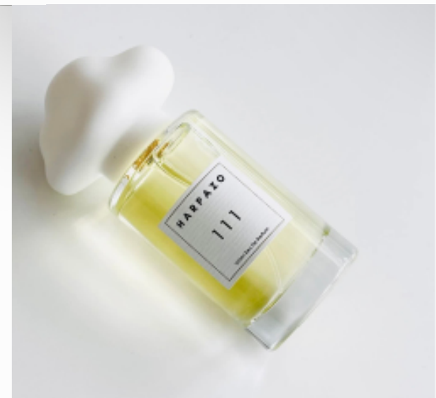
111 不知之雲香水系列 →