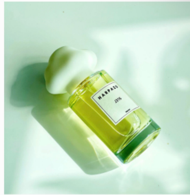
J316 不知之雲香水系列 →