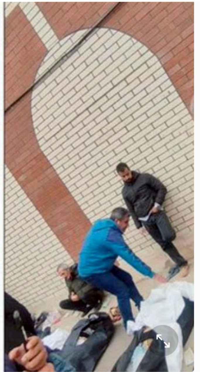
網路影片截圖顯示，德黑蘭南郊一間法醫鑑識中心停滿了屍體。