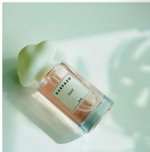
T417 不知之雲香水系列 →