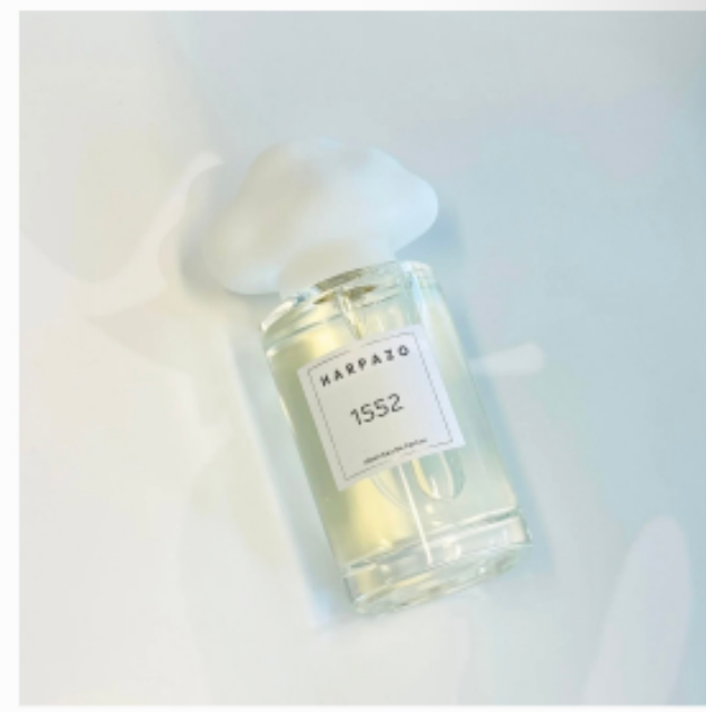
1552 不知之雲香水系列 →