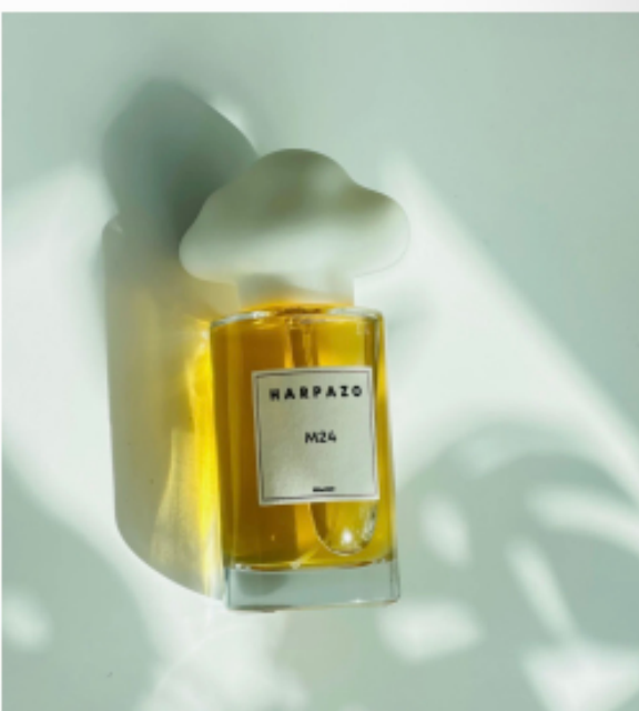
M24 不知之雲香水系列 →