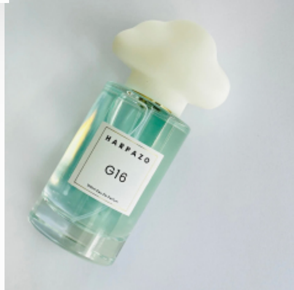
G16 不知之雲香水系列 →