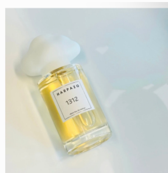
1312 不知之雲香水系列 →