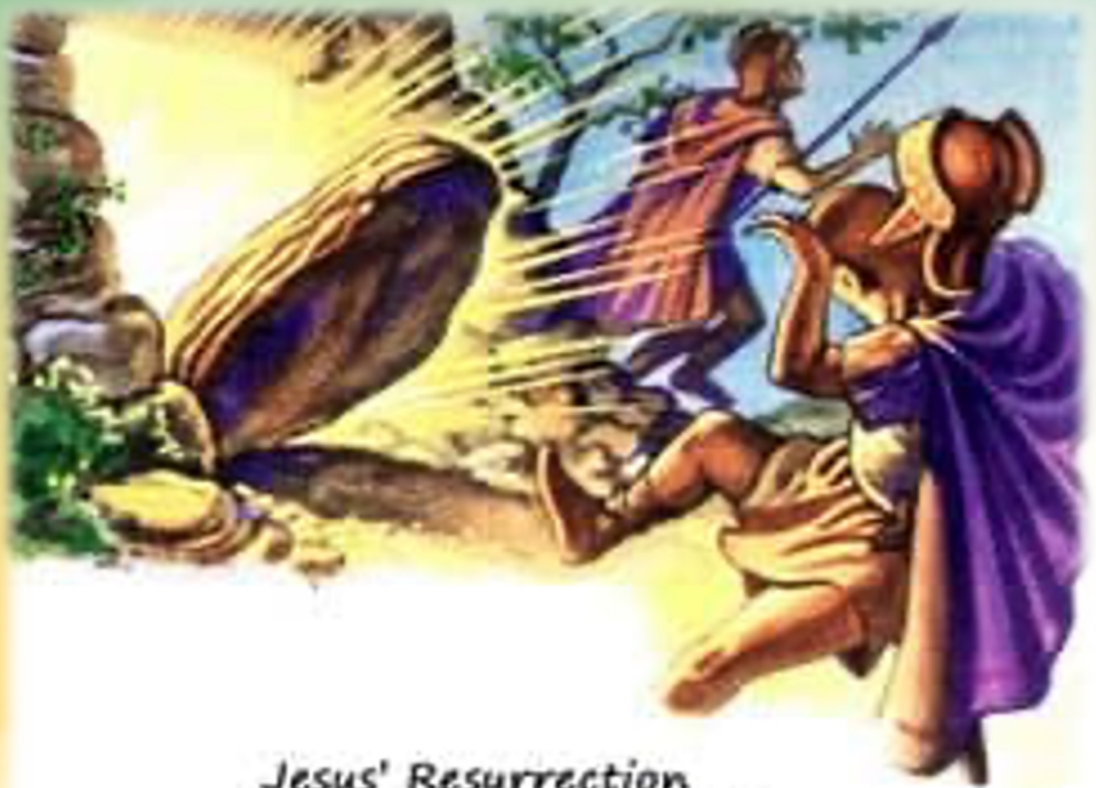
Jesus' Resurrection - The Guard's Report